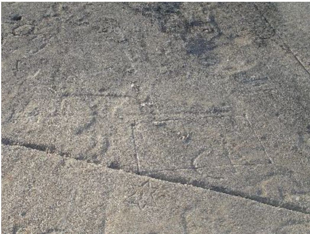
Personnage en sablier avec lance (Aussois) (Des gravures récentes se superposent aux gravures anciennes)