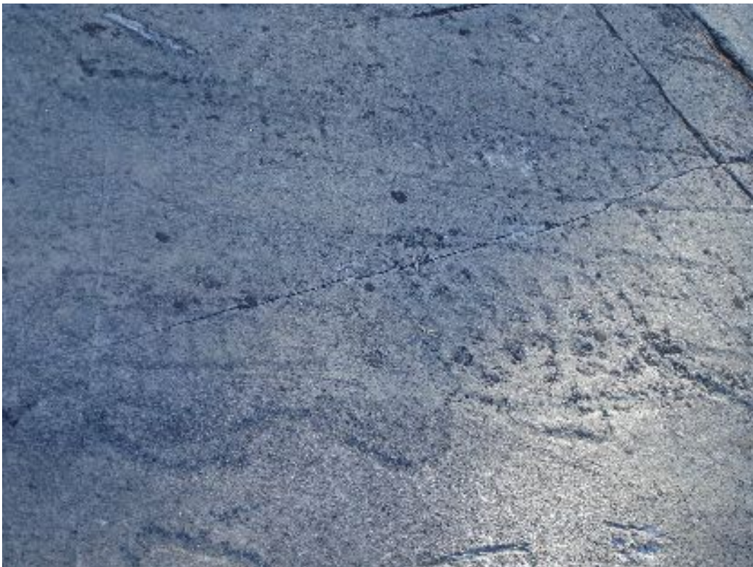
Echelle, serpentiforme, quadrangulaire à ponctuation interne (Aussois)