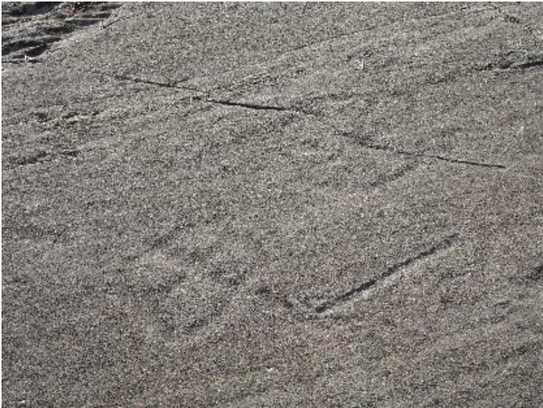
Représentation quadrangulaire à médianes et cercle à rayons (Aussois)