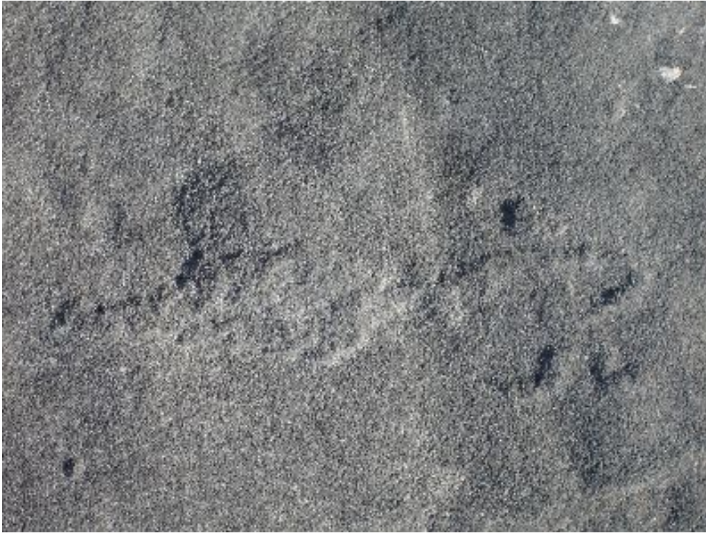
Personnage avec poignard (Aussois)